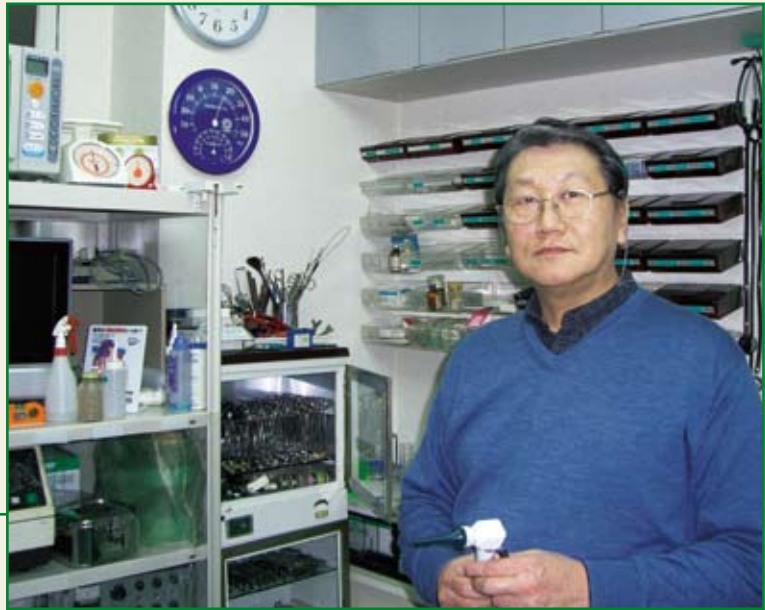
先生が手にしているのはオトCCDスコープ「ME-16」。耳疥癬等の診断・撮影に使用している。[K]